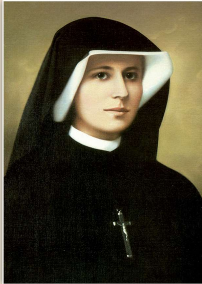
Santa sor Faustina