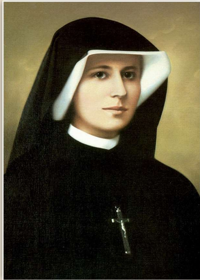
Die heilige Faustina